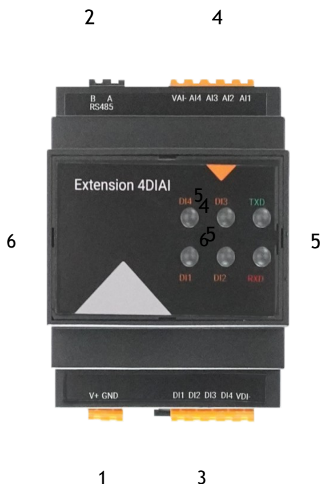
Abbildung 2: Anschlussbezeichnung und Legende