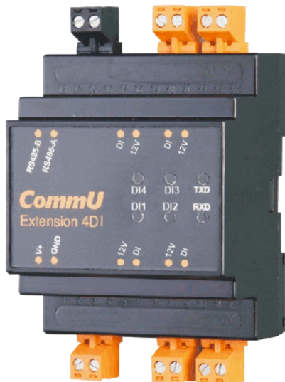
Abbildung 1: CommU Extension 4DI